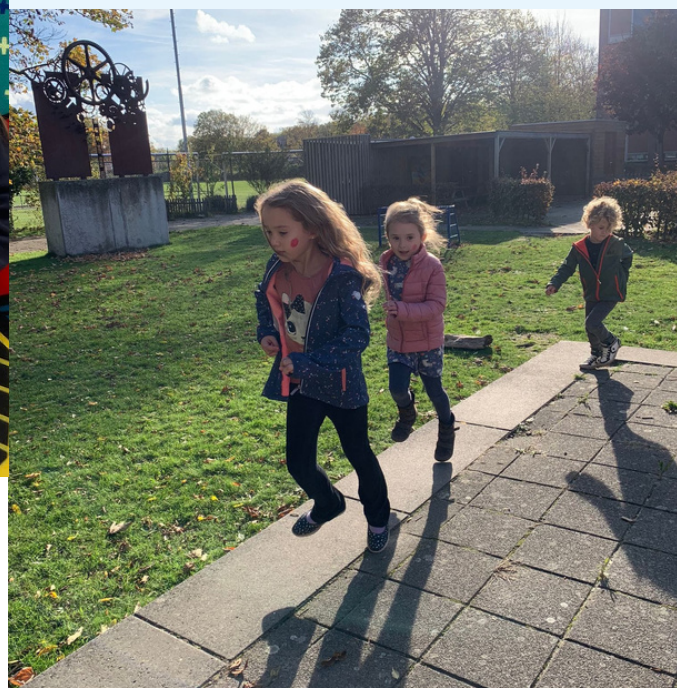
Bootcamp op de vakantie BSO Terneuzen