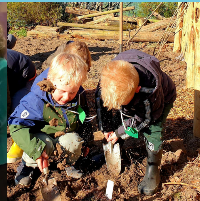
Aanleg voedselbosje Villa Reyntje