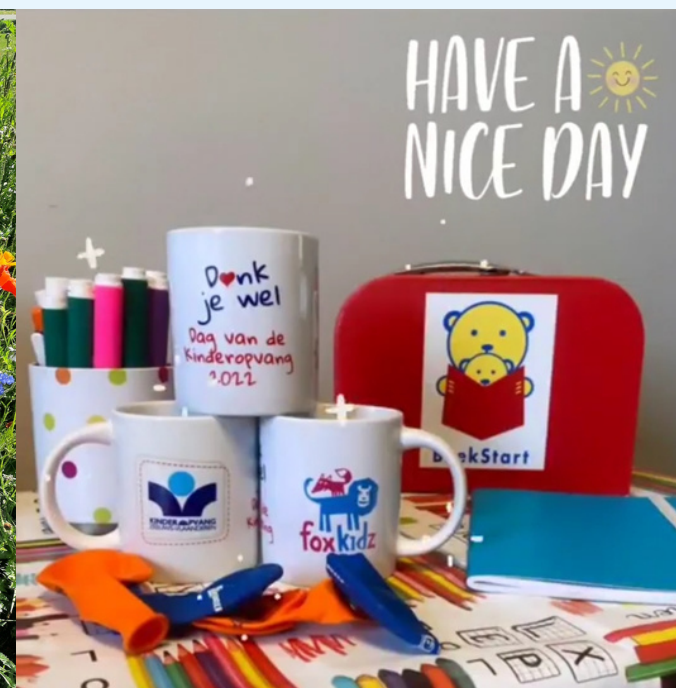
Dag van de kinderopvang