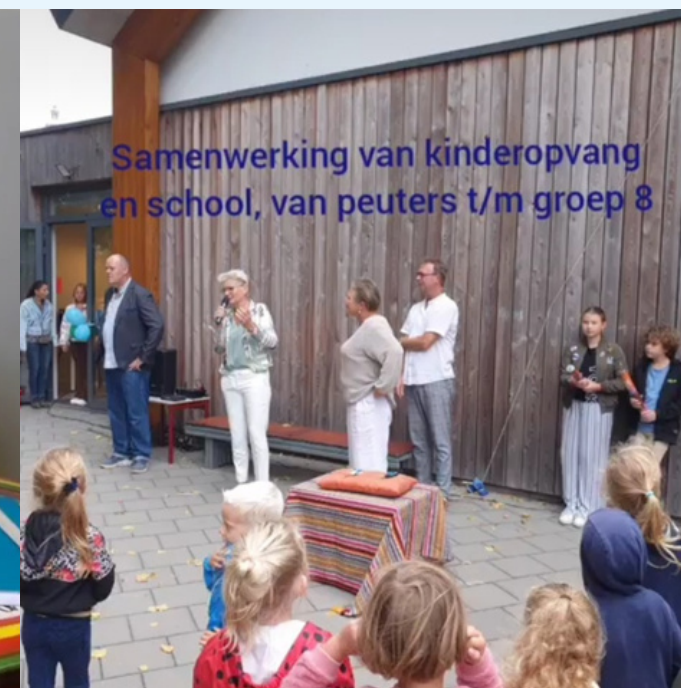
Opening IKC Willibrordus