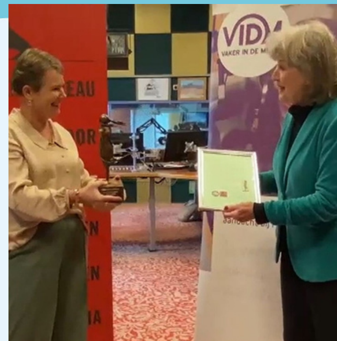
Vrouw in de media award