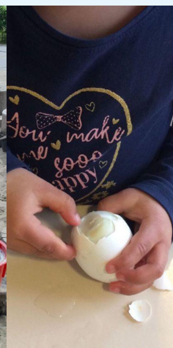
Talentlokaal Sas van Gent