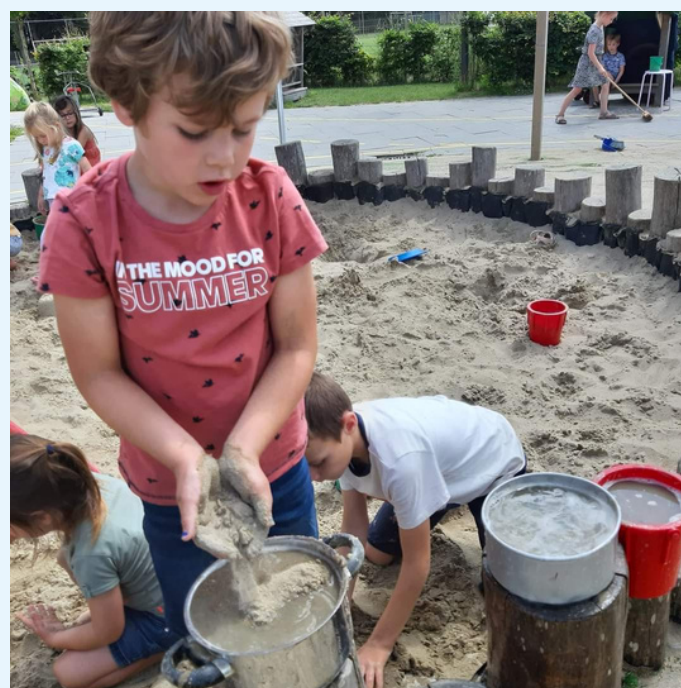
Modderdag op alle locaties