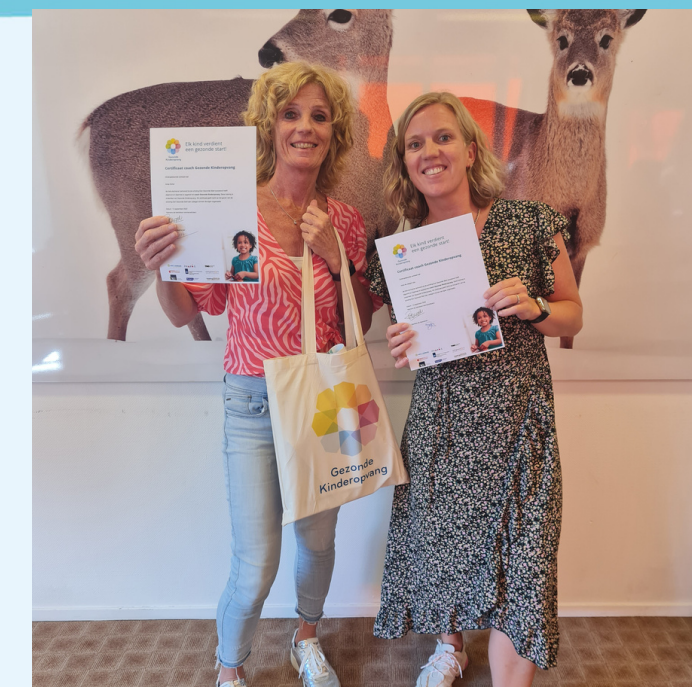
Collega's gastouderbureau gecertificeerd coach Gezonde Kinderopvang