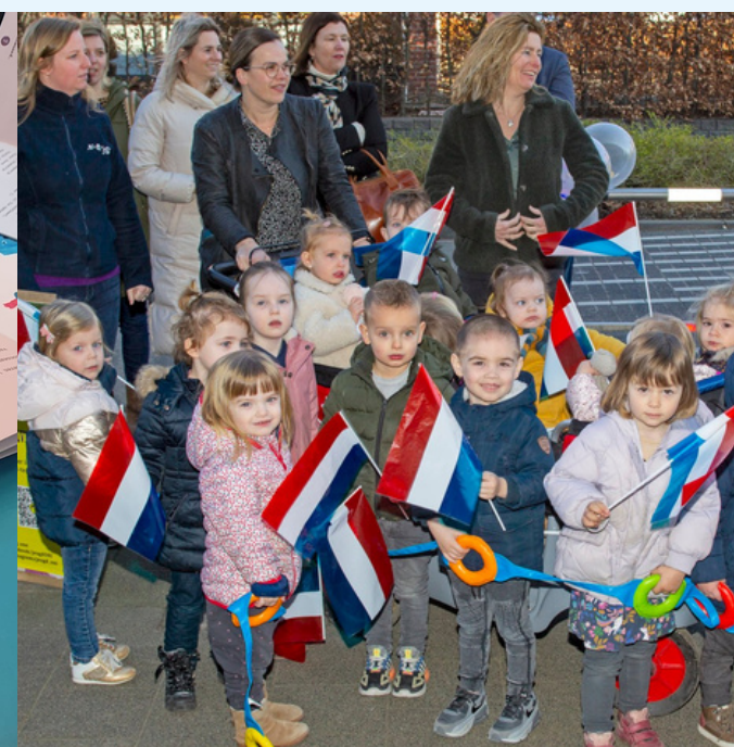
Heropening brede school Othene