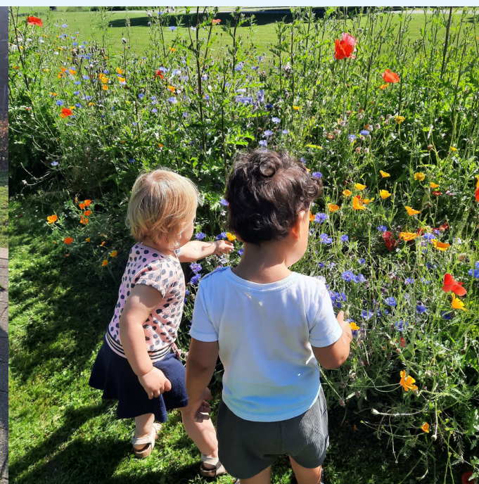
Kinderboekenweek Giga Groen op alle locaties