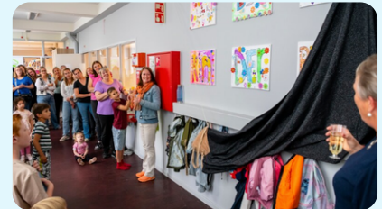
Opening structuur bso Terneuzen