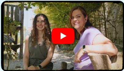
45 jaar kozv