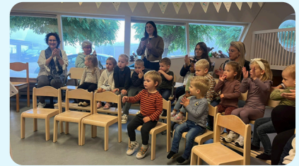
Feestelijke opening voorschool Axel