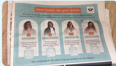
Campagne Samen bouwen aan grote dromen